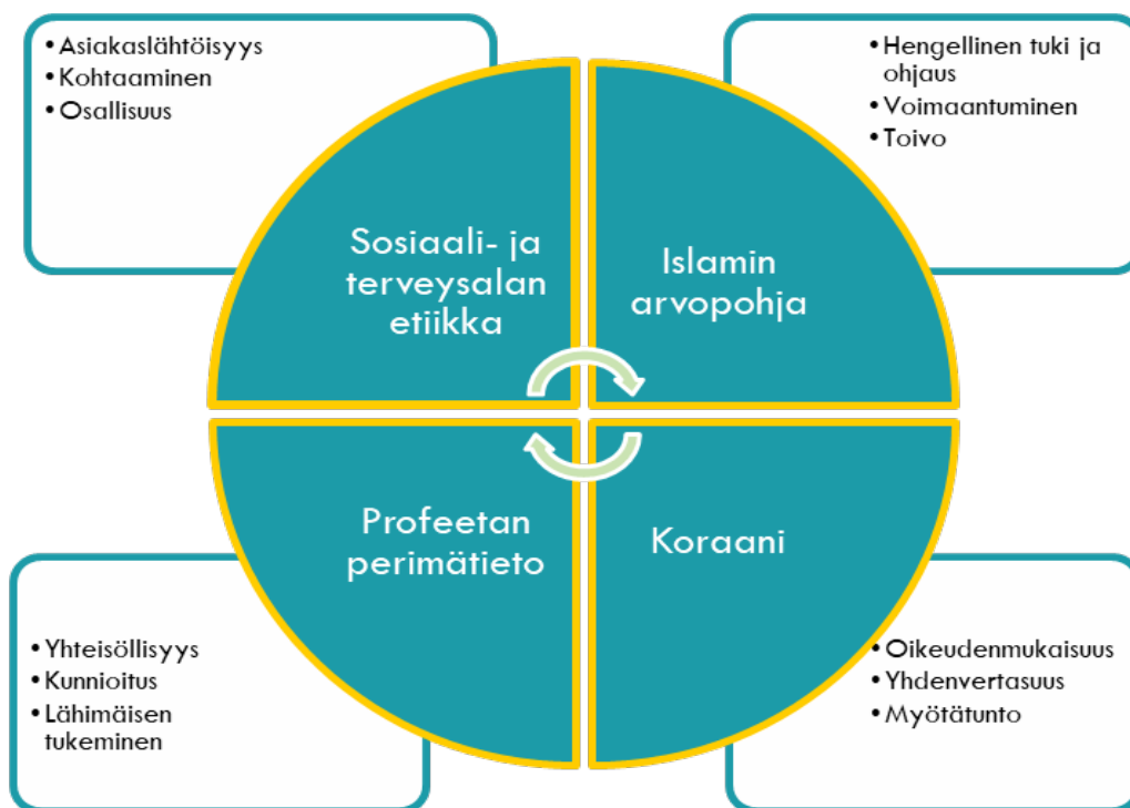
KUVIO 1: AMAL RY:N TOIMINTAMALLI KUVATTUNA

Diakoniatyöstä poiketen Amal ry:n uskontotietoisessa työotteessa on perustana islamiin pohjaava arvoperusta, jossa hengellisen sosiaalityön ja hoidon taustoitukseksi ovat Koraani ja Profeetan (rh) perimätietoon eli sunnaan. Islamiin perustuvassa uskontotietoisessa toiminnassa vaikuttaa ajatus siitä, että ihminen on luotu kokonaisuudeksi, jossa psyykkiset, fyysiset, mentaaliset sekä hengelliset osa-alueet toimivat toisiinsa kietoutuneina. (Ghafournia 2017.)